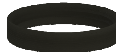
Уплотнительное кольцо ТП-76.100