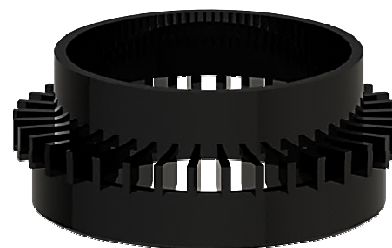
Дренажное кольцо ТП-74.100

Высота надставного элемента регулируется путем подпила до необходимого уровня. После окончания монтажных работ в корпус устанавливается трап.